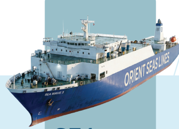
SEA WAVE 3