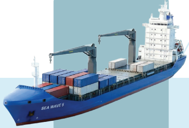
SEA WAVE 5