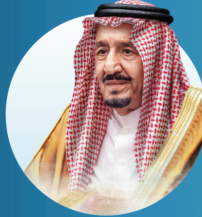
صاحب السمو الملكي الملك

موقع جغرافي مميز جداً لا يوجد إلا لدينا، أهم 3 مضائق بحرية في العالم . . تقريباً 30 في المئة من التجارة العالمية تمر في البحر من خلالك . لدينا فرص ضخمة لخلق خدمات لوجستية ، سواء في الطيران أو الموانئ أو المجمعات الصناعية .