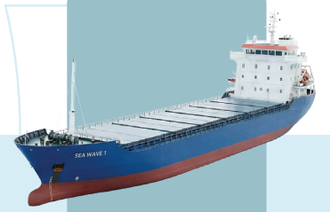
SEA WAVE 1