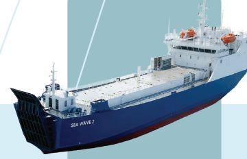
SEA WAVE 2