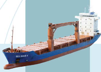
SEA WAVE 4